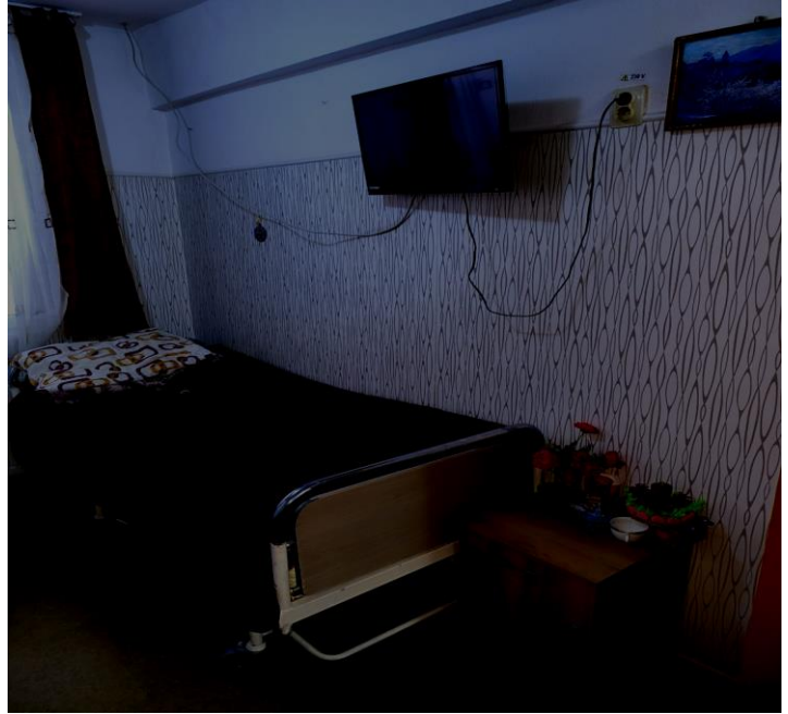
Sef complex Harastasan Florica Nadia